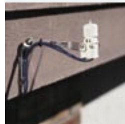
Compatible avec sondes météorologiques